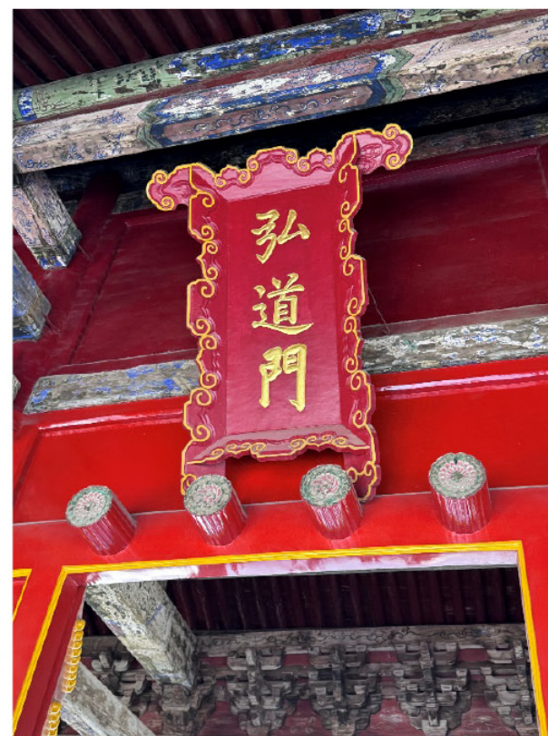
庄重肃穆的三孔景区