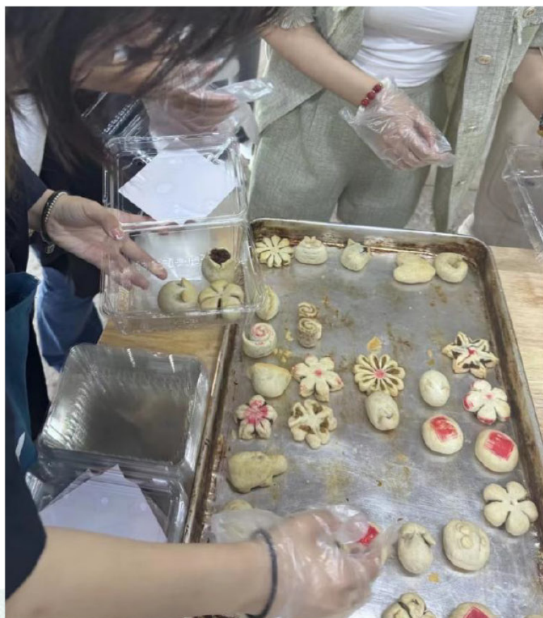
(我们组员在糕点制作活动中)